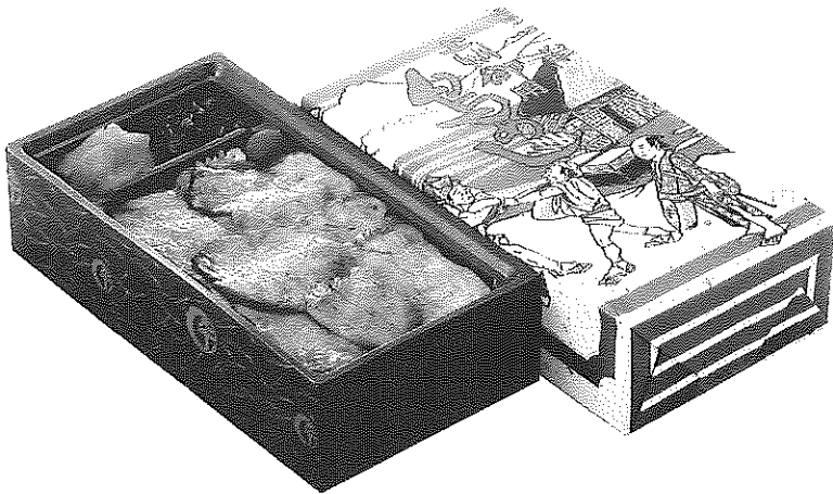
▲上州御用 鳥めし弁当(竹)